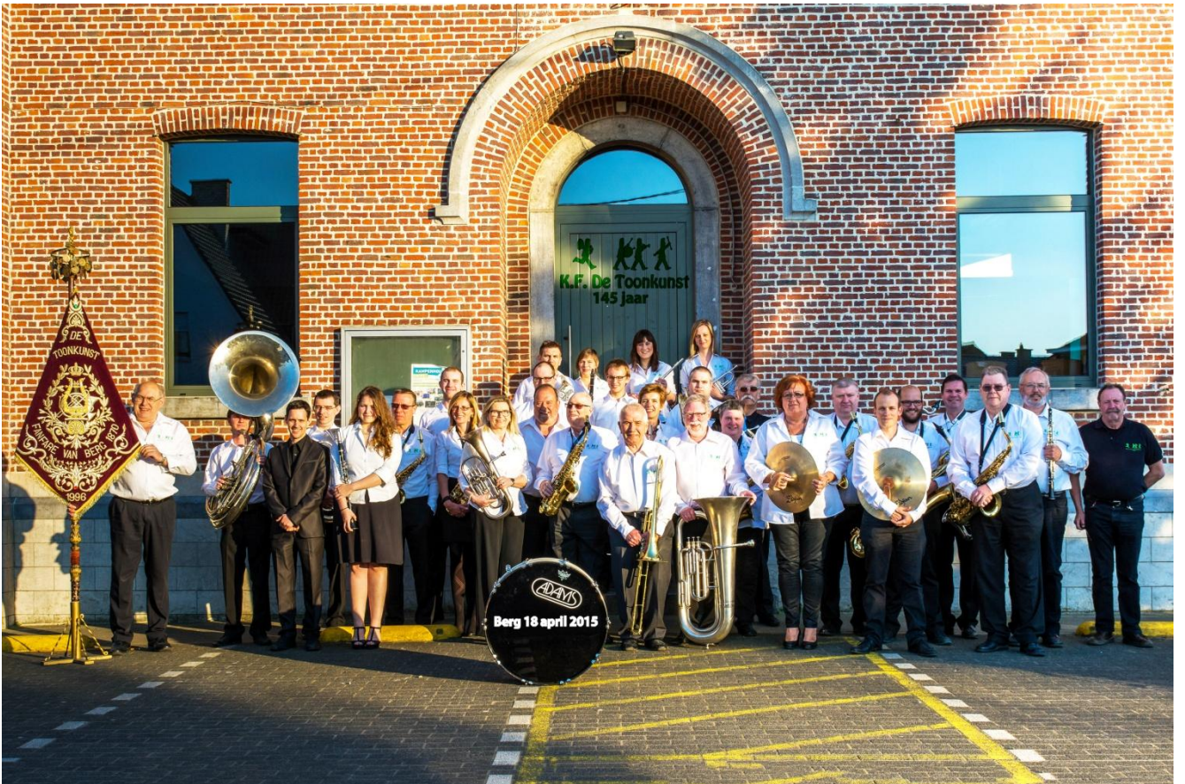
De Koninklijke Fanfare De Toonkunst 145 jaar jong

Hierbij nog enkele foto's van het Herfstconcert van vorig jaar van een fan uit het publiek